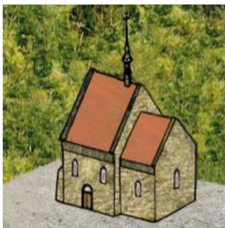
Předpokládaný vzhled kostela